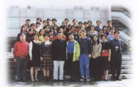
▲校長與「生涯義工場」成員合影。

去年十月，台灣失業率創下5.33%的歷史新高，其所影響的家庭人口總數，超過百萬人之譜。學校為協助非自願離職勞工子女順利完成學業，並奉教育部去年十月廿二日來函指示：「學、雜費所提撥之就業獎補助經費，用於失業家庭子女及其他家庭經濟特殊困難之助學金或學雜費減免，九十學年度不得低於百分之七十。」學校乃在獎、助學金原有的項目中，增列「非自願離職勞工子女助學金」一項，每名發給伍仟元；然而，此項美意必將壓縮到學校原有的獎、助學金金額。因此，部份獎助學金的金額，經本校「行政會議」修正通過調整如下：「清寒獎學金」調整為貳仟元，「在校期間獲得乙級甄照技術學生獎學金」調整為貳仟元，「升學獎學金(限本校學生考上本校並就讀者)」調整為參仟元；此外，「校頒各班獎學金」分別調整為「第一名」肆仟元，「第二名」參仟元，「第三名」貳仟元。學校各項獎、助學金，經過此次適時的調整，必能獲得更有效的運用，使同學們的求學之路，得到更為完善的獎勵及照顧。