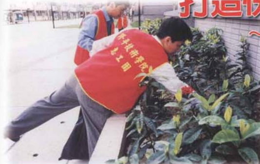
▲學務長帶領「教職員工志工服務團」維護校園環境

「人生以服務為目的」是大家耳熟能詳的一句話，但是唯有真正去實踐的人，方能體會其中深遠的涵意及喜悅。人類是群居的，在與他人接觸的過程中，「施」比「受」更能得到心靈的喜悅，所謂「施比受更有福」，「助人為快樂之本」，也就是這個道理。