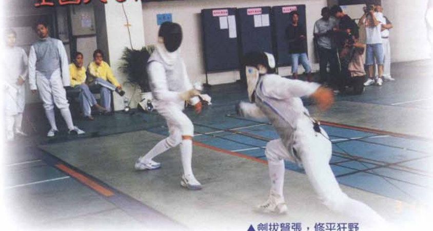
▲劍拔弩張，修平狂野

從四月底開始，你有沒有發現學校及鄰近地區，到處旗海飄揚？沒錯！五月三日五月六日「全國大專院校西洋擊劍賽」在修平熱烈展開，吸引包括政大、交大、輔大、海洋大學、淡江大學、陸軍官校及空軍官校等二十幾所大專院校擊劍社與校隊好手，前來參加這場盛會，將學校妝點的熱鬧非凡。