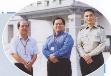
▲充滿服務熱誠的舒組長(右一)與勞作教育組員合影

本校於八十九學年度於學務處成立勞作教育組，負責推動學生勞作教育課程，希望同學能透過勞作教育課程的訓練，建立勤勞動手的觀念。在每週實際參與服務工作及各項DIY課程訓練與輔導的規劃下，努力推展志願服務工作的理念，培養同學勇於付出服務熱誠及負責的精神，共同塑造受校、勤勞、負責及合作的校園文化，以建立優良校風；而這個養成教育，對同學日後的生涯發展、職場表現，都將有極大的助益。