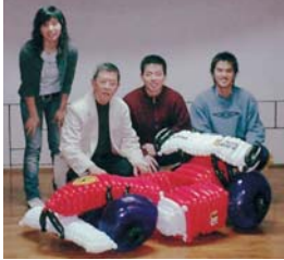
小東西大創意 (相關報導請見第四版)