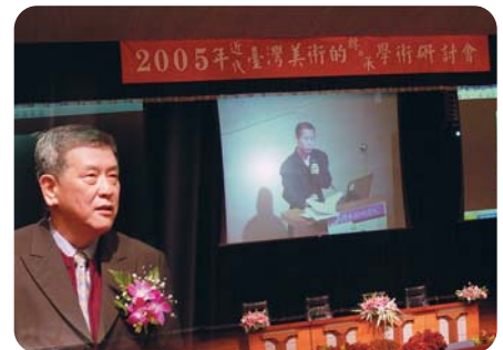
▲2005年近代臺灣美術的轉與承學術研討會

這是一場幽雅的知識饗宴，它不僅吸引眾多的教師、學生，以及熱愛美術的社會人士前來聆聽，更讓大家在關心近代臺灣美術發展的觀念交流中，得以拓展視野、開放胸襟；進而去思索臺灣美術教育的定位與落實等諸多問題。且由於它的核心議題在於談論近代、本土與美學，這在輕忽歷史傳承，耳聞粗鄙語言的當今社會，實在具有暮鼓晨鐘，震聾發聵的醒世意義。