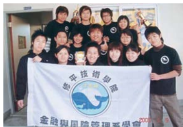
▲金融與風險管理系學會成員

新學期，我們帶著感恩的心，將更努力、更用心，規劃更多貼近同學的活動，以饗同學的託付。本學期活動預計有家族聚會、第一屆商管盃籃球、排球賽、還有！還有第一屆金管盃股王競賽..等等，記得要來參加喔！