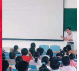
兩岸交換學者短期教學 (相關報導請見第三版)

校址：台中縣大里市工業路十一號 電話：(04) 2496-1100 傳真：(04) 2496-1187 印製：麥克優仕全方位設計公司 電話：(04) 36116670