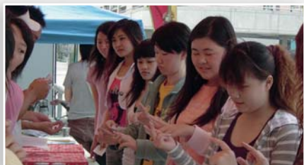
▲健康週活動情形

乙份，校內有美食街廠商一修小吃部、生活便利屋提供捐血前50名慷慨挽袖的學生，免費獲炒麵、麵包各一份；休閒魯味、第一自助餐、味覺食堂、元氣鐵板燒、一番屋美食、奇緣簡餐、豆人鬆餅、極品美食，提供消費折價等優惠，一群人默默付出令人感動。