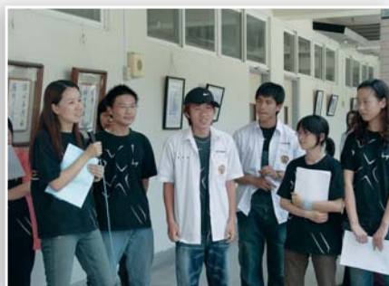
▲應用中文系時展活動情形

本次聯展，不僅讓應用中文系的同學們得到了珍貴的作品發表機會，更希望能夠藉由系上作品的展出，讓其他科系的家族成員們可以更瞭解、貼近應用中文系的學術領域，並將文學風氣帶入校園，進而塑造出文武雙全，充滿人文氣息的新修平。