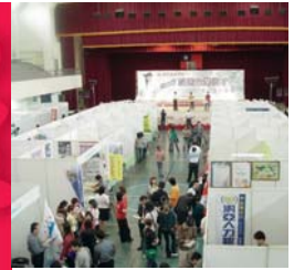
校友創業展 (相關報導請見第四版)

校址：台中縣大里市工業路十一號 電話：(04) 2496-1100 傳真：(04) 2496-1187 印製：麥克優仕全方位設計公司 電話：(04)36116670