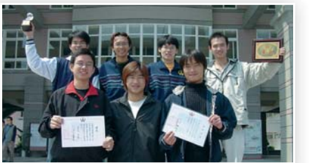
▲馬來西亞僑生合影

歲月不饒人，不知不覺的來台唸書已有半年的時間了，小時候的歲月真愉快、沒有煩惱、沒有憂愁；天大的事也有父母為我們撐著，長大了則要學會自立更生。在我的人生規劃裡，完全沒想過會來修平技術學院唸書，在修平裡老師和同學都很和氣、平易近人，發揚校長的辦學理念「師生手足情，合作如家庭」的情感。雖然我們是外籍生，但老師們及教官們給予的關懷及照顧，猶如父母般的親切，在寒流來時，師