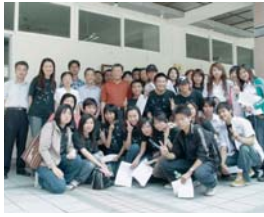
修平五月天 (相關報導請見第三版)