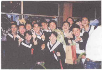
鼓聲響起 畢業典禮 NEW IDEA 樹仔腳的傳奇、大里杙的曼波、 真情告白、唱得比說的好聽