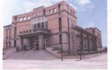
修平願景起飛 衝刺科技大學 預計九十一學年 新增四技二技科系 五專二專減班調整 〔第三版〕