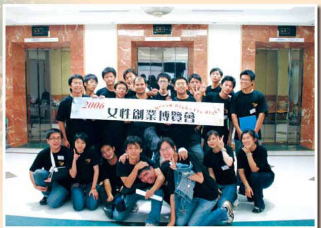
▲女性創業博覽會生涯志工坊合影(就業及校友服務組提供)

經由本校研究發展處就業及校友服務組培育計畫，我參加了四個階段的志工培訓，一路走來的堅持與執著，終於拿到志工證書，與一群志同道合的好朋友，不分彼此的科系，一起努力為生涯志工坊付出，服務過程中深刻體會團隊與分工重要性，學會了包容與尊重，在修平校園舞臺裡服務人群，使我的學生生涯是充實的。