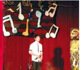
春天吶喊修平K歌王 (相關訊息請見第三版)

校址：臺中縣大里市工業路十一號 電話：(04) 2496-1100 傳真：(04) 2496-1187 印製：興台彩色印刷股份有限公司 電話：(04) 22871181