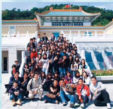
▲故宮博物院參與活動之師生

應中系日前舉辦故宮博物院北宋藝術大觀特展和大英博物館世界文明瑰寶展藝文參訪活動，共有111名師生參加。活動結束後，舉辦心得寫作比賽，以創作詩文來驗收參訪成果，期望學生體認文學與藝術的內涵，提昇人文素養。