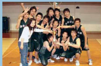
▲資訊管理系籃球隊