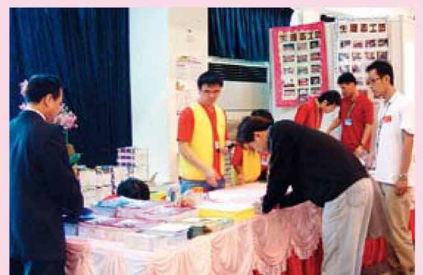
◀捐血活動