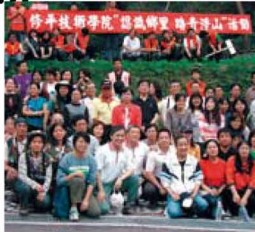
認識鄉里、踏青淨山總動員 (相關訊息請見第二版)