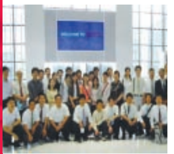
日本豐田研習一知性之旅 (相關報導請見第三版)

校址：台中縣大里市工業路十一號 電話：(04) 2496-1100 傳真：(04) 2496-1187 印製：興台彩色印刷股份有限公司 電話：(04) 22871181