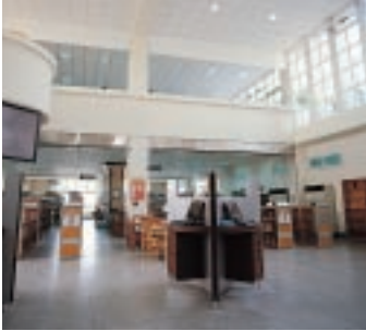
慨捐書冊香遠傳 (相關報導請見第二版)