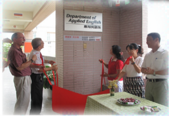
【應英系校友捐贈名牌儀式】