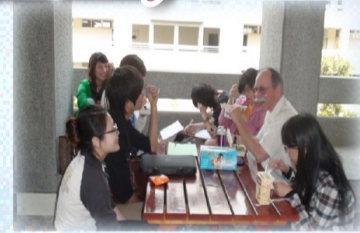
【應英系師生午餐約會】

The Hsiuping Monthly asked the Department of Applied English to struggle with an appropriate topic for our first attempt, especially when there is the potential of having photos and names in the article. It makes us tremble. At last, we decided not to be complicated, but just to be straightforward by simply making an introduction. It seems to be such a good idea and simple, right?