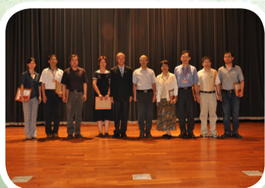
【特優導師與校長合影】