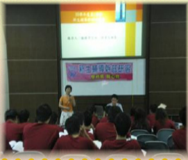
◎學生事務處生活輔導組

為了迎接修平新鮮人，本次學務處生活輔導組特別於9月9日舉辦「新生輔導幹部研習」，期盼各系學長姊能於新生入學時給予最大的支持。活動由學務長主持，並邀請相關處室組長給予課程授課。會後，生活輔導組組長特別期許所有幹部能以負責、服務、與學習領導等觀念自我提升來勉勵幹部。