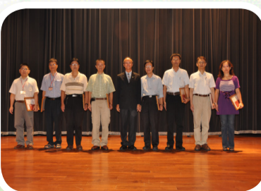
【績優導師與校長合影】