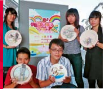
「漆陶廊—數媒系彩陶展」 (相關新聞見第四版)

校址：臺中縣大里市工業路十一號 電話：(04) 2496-1100 傳真：(04) 2496-1187 印製：興台彩色印刷股份有限公司 電話：(04) 22871181