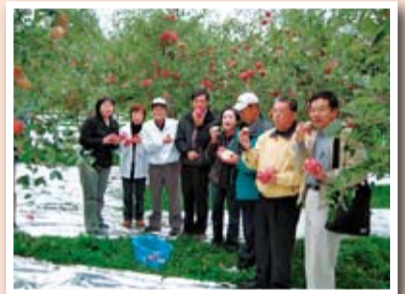
▲參訪團於蘋果園合影