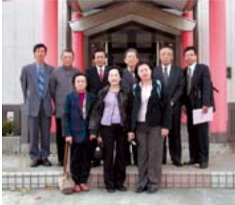
赴日本青森中央學院大學學術交流合影 (相關新聞見第三版)